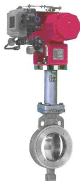
超低温用 エクステンションボンネットタイプ 調節弁 ユニコ