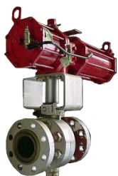
クラス900 プロピレン製造装置 緊急遮断弁